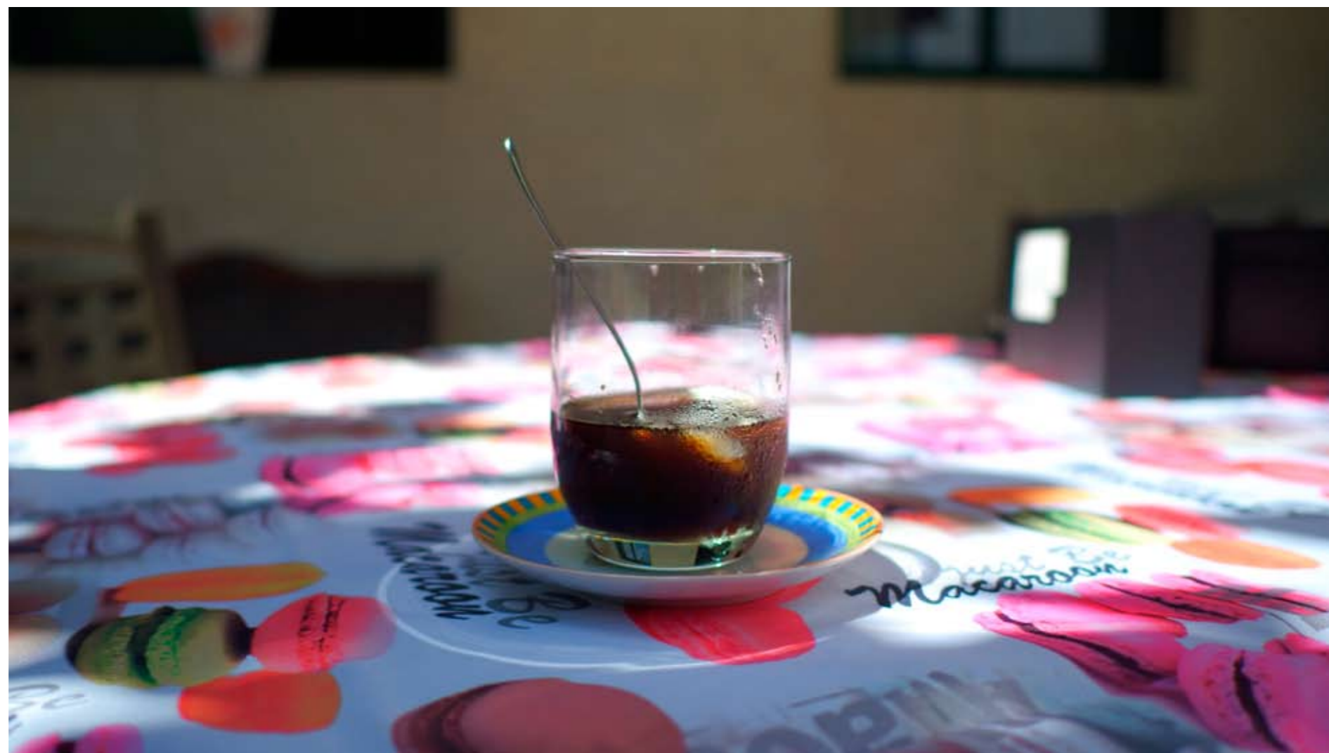
IAGO CONDE LONGO A tranquilidade dun café