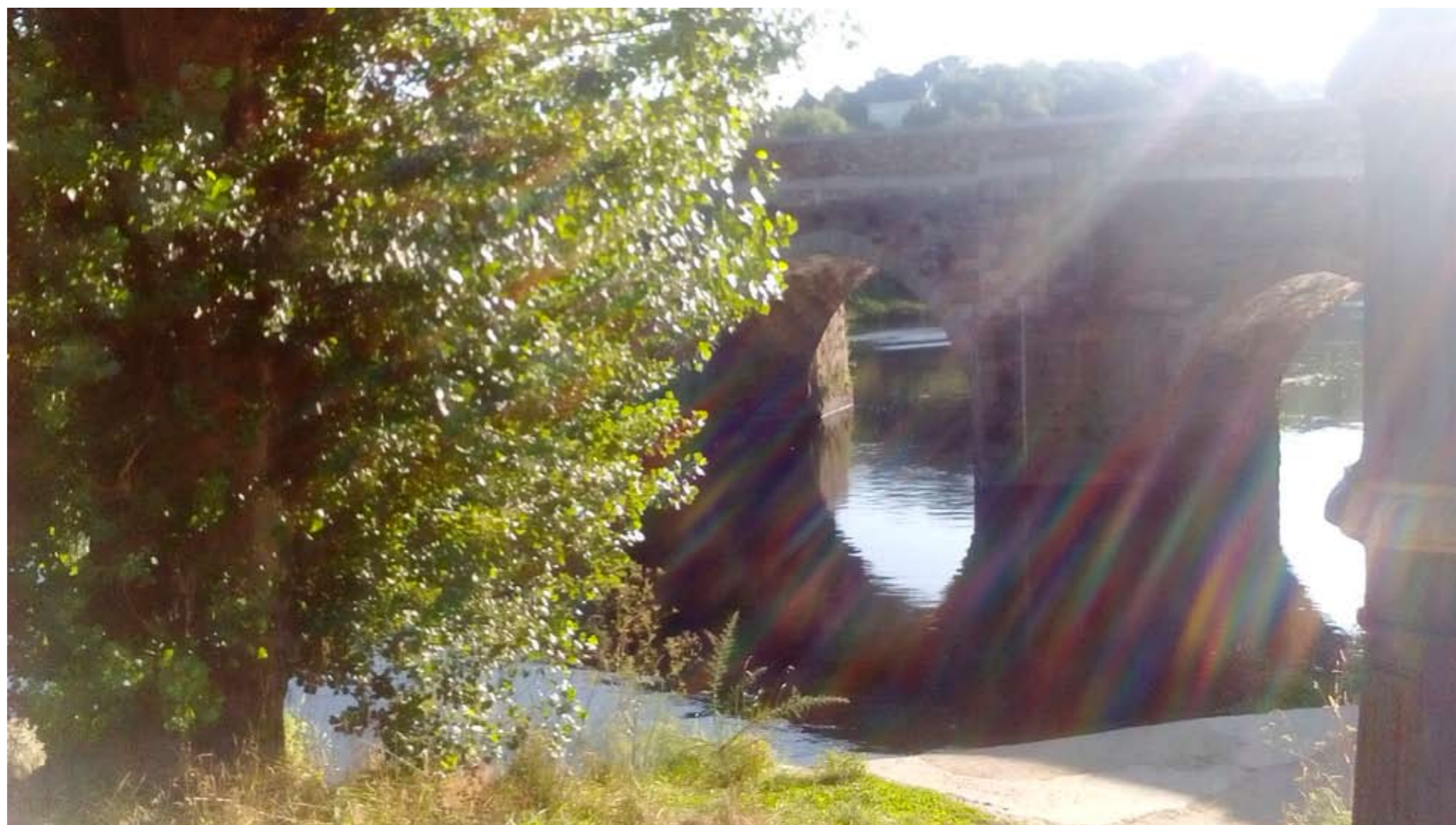
ALBA FERNÁNDEZ MOURÍN A vella árbore