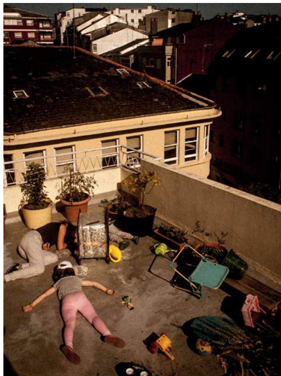
JOSÉ MARCOS LÓPEZ ÁLVAREZ Obra premiada: Familia terrícola morta por mor do lixo espacial