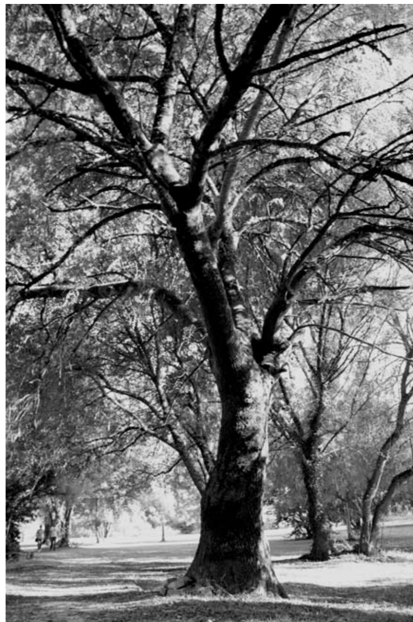
ROSALÍA RODRÍGUEZ DOSIL Os camiños da vida