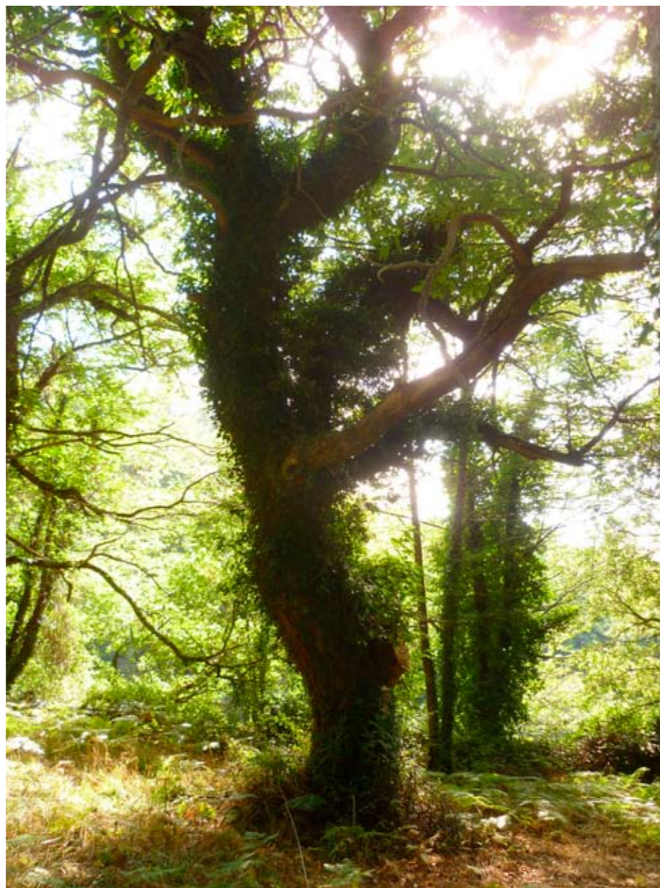
JAIME FUENTETAJA OLMOS A árbore (aínda) segue en pé a pesar da man do home e do lume