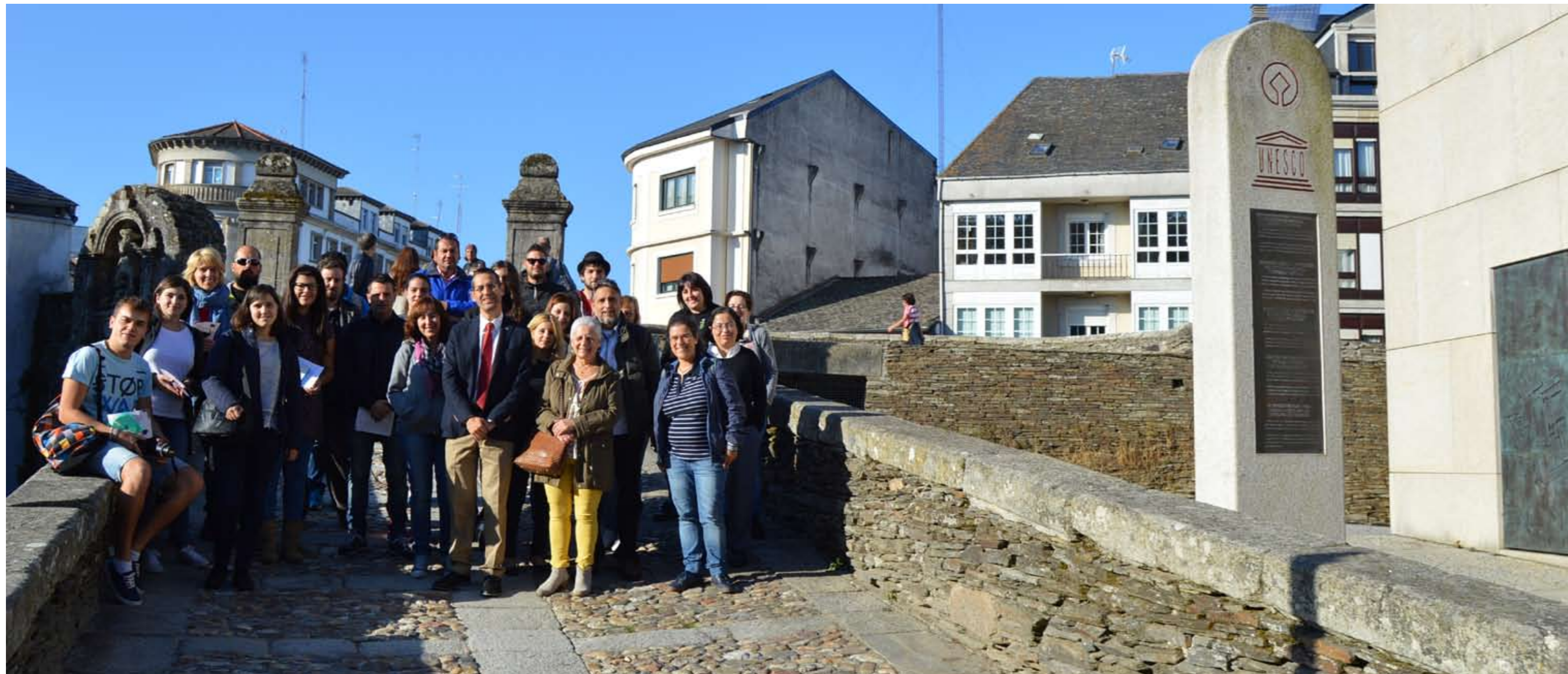
PARTICIPANTES NO XXII MARATÓN FOTOGRÁFICO DO CAMPUS