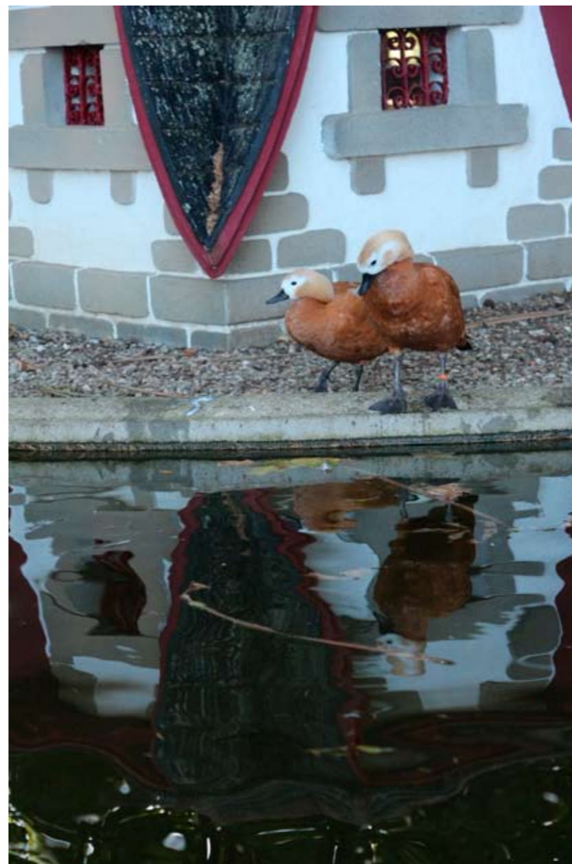
BELÉN REIJA OTERO Patos no parque